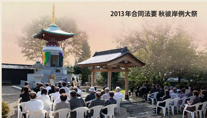
2013年合同法要 秋彼岸例大祭

継承者がいなくなっても、本覚寺が在りつづける限り供養・管理が続けられるお墓です。